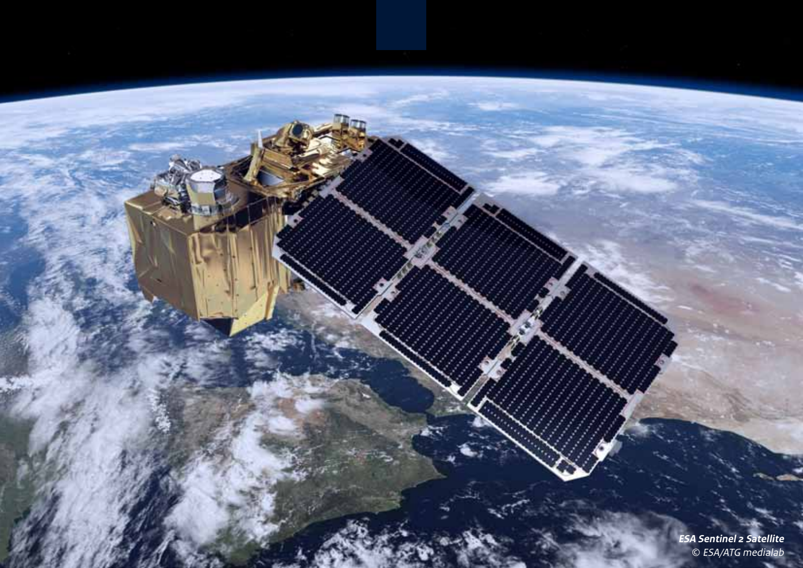
ESA Sentinel 2 Satellite

La subvention G4AW va pour cela développer :